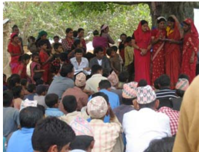
स्वास्थ्य र सरसफाई जनचेतना गीत गाऊँदै ग्रामिण महिलाहरु