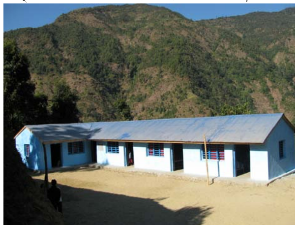
प्यूठान खवाङ्ग गा.वि.स.मा संस्थाबाट निर्मात एक सामुदायिक प्राथमिक विद्यालय भवन