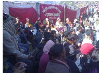
वाहाने डाम्री ग्रामिण सडक उद्घाटन कार्यक्रममा सहभागी पार्टी प्रतिनिधि तथा अन्य सरकारी गैरसरकारी प्रतिनिधिहरु