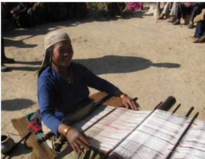
प्रम्परागत राडी आयआर्जनको राम्रो स्रोत हुँदै छ ।

संस्थासंग कार्यालय संचालन र परियोजना व्यवस्थापनका लागि आवश्यक मानव संसाधन, कार्यालय र भौतिक साधन एवं उपकरणहरूका सुविधाहरू विद्यमान छन् ।