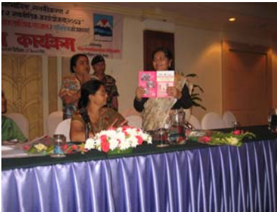
सर्वेक्षण प्रतिवेदन विमोचन गर्दै माननीय रक्षा मन्त्री विद्या देवी भण्डारी