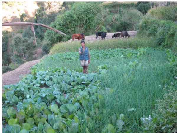
आफ्नो व्यवसायिक तरकारी खेती देखाऊदै डाम्रीका एक किसान