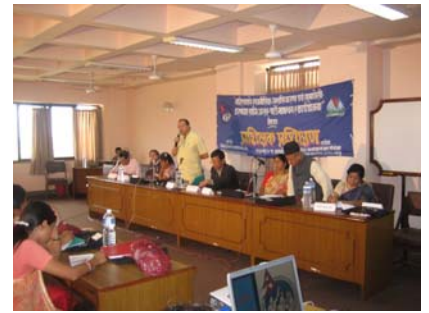
एमाले अध्यक्ष भलनाथ खनाल महिला लोकतान्त्रिक सञ्जालको कार्यक्रममा मन्तव्य दिदै