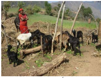
सफल बाख्रापालक व्यवसाई