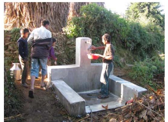
प्यूठान जिल्लामा खानेपानीको धारा सफा गर्दै एक उपभोक्ता