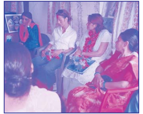
महिला लोकतान्त्रिक सञ्जाल डोटीका पदाधिकारीसँग सञ्जाल गतिविधिबारे छलफल गर्दै दातृ संस्था RDIF का अधिकारीहरु