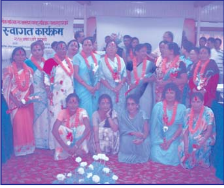
महिला लोकतान्त्रिक सञ्जाल केन्द्रीय समितिले गरेको सम्मान कार्यक्रमपछि सामुहिक तस्वीर खिचाउँदै सञ्जाल सम्बद्ध संविधान सभासदहरु