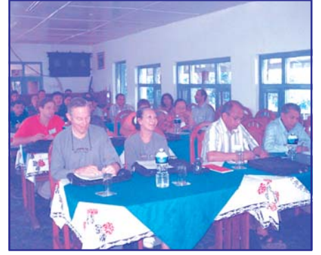
पुनर्जागरण समाज नेपालद्वारा ब्यवस्थापन गरिएको संयुक्त राष्ट्र संघीय खाद्य तथा कृषि संगठन (FAO) को जेष्ठ २ देखि ४ सम्म तनहुँको बन्दीपुरमा आयोजित गोष्ठीका सहभागीहरु