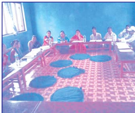
सिन्धुली जिल्लामा जेष्ठ २६ गते राजनीतिक दलका नेताहरु र सञ्जाल प्रतिनिधि बिच रणनीतिक कार्ययोजना माथि छलफल गरिँदै