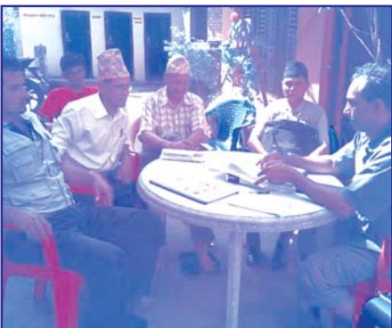
धाडिङ जिल्लामा जेष्ठ ९ गते रणनीतिक कार्ययोजना माथि छलफल गर्दै राजनीतिक दलका नेताहरु