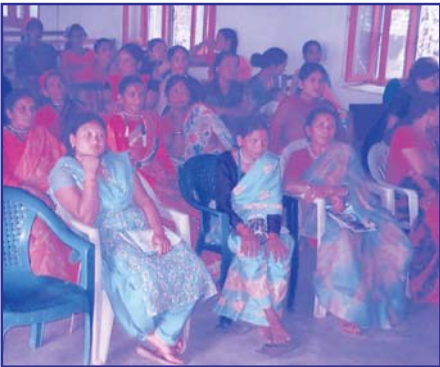
महिला लोकतान्त्रिक सञ्जाल डोटीको नयाँ कार्यसमितिको निर्वाचनका लागि आयोजित अधिवेशनका सहभागीहरु