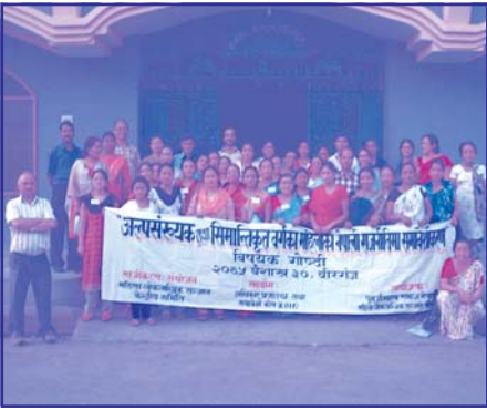
बैशाख ३० गते बीरगंजमा सम्पन्न अल्पसंख्यक तथा सिमान्तकृत वर्गका महिलाको राजनीतिक समावेशीकरण सम्बन्धी गोष्ठीका सहभागीहरु