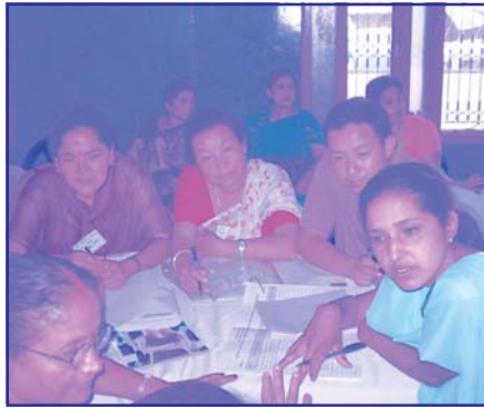
समावेशीकरण गोष्ठीमा राजनैतिक दलमा समावेशीकरण अभिवृद्धिका लागि दलगत रणनीतिक कार्ययोजना निर्माणमा व्यस्त सहभागीहरु