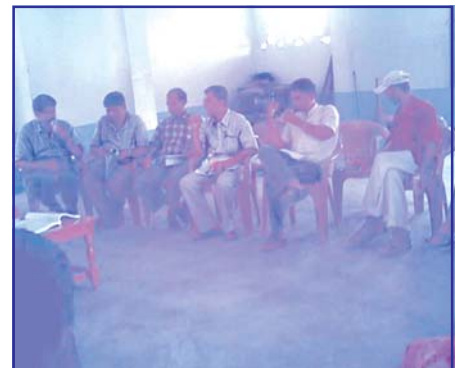
महोत्तरी जिल्लामा जेष्ठ २७ गते रणनीतिक कार्ययोजनामा छलफल गर्दै राजनीतिक दलका प्रतिनिधिहरु