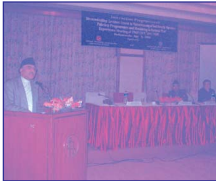
पुनर्जागरण समाज नेपाल र राष्ट्रिय योजना आयोगको संयुक्त तत्वावधानमा होटल हिमालयमा जेष्ठ २७ गते आयोजित खाद्य सुरक्षा सम्बन्धी गोष्ठीलाई सम्बोधन गर्दै राष्ट्रिय योजना आयोगका उपाध्यक्ष डा. जगदीश चन्द्र पोखरेल