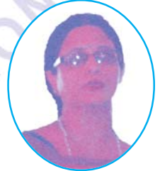
सेख चाँद तारा सदस्य