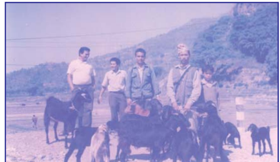
पुनर्जागरण समाज नेपालद्वारा संचालित गरिवी निवारण कोष कार्यक्रम अन्तर्गत आय-आर्जन अभिवृद्धिका लागि बाख्रा पालनबाट लाभान्वित प्युठान जिल्लाका किसानहरू