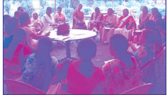
नेपालगञ्जमा आयोजित महिलाको राजनीतिक सहभागिता अभिवृद्धि, सशक्तिकरण र समावेशीकरणका लागि दलहरूको रणनीतिक कार्ययोजना विषयक क्षेत्रीय कार्यशाला गोष्ठीमा छलफलमा ब्यस्त सहभागीहरू