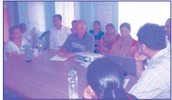
पुनर्जागरण समाज नेपालद्वारा संचालित महिला लोकतान्त्रिक संजाल परियोजनाको त्रैमासिक प्रगति समीक्षा बैठकमा सहभागी परियोजना कर्मचारी र RDIF/ESP का प्रतिनिधिहरू