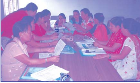
इटहरीमा आयोजित महिलाको राजनीतिक सहभागिता अभिवृद्धि, सशक्तिकरण र समावेशीकरणका लागि दलहरूको रणनीतिक कार्ययोजना विषयक क्षेत्रीय कार्यशाला गोष्ठीमा छलफलमा ब्यस्त सहभागीहरू