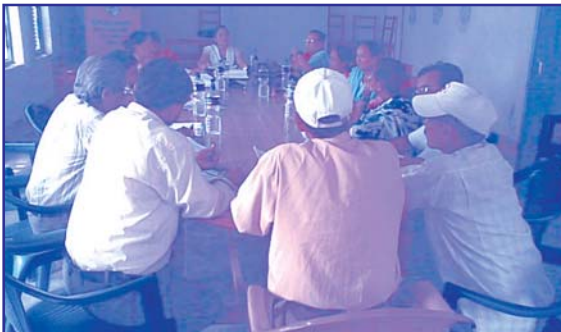
राजनीतिमा महिलाको सहभागिता अभिवृद्धि, सशक्तिकरण र समावेशीकरणका लागि दलगत रणनीतिक कार्ययोजना निर्माणका लागि नवलपारसीमा आयोजित जिल्लास्तरीय गोष्ठीमा ब्यस्त नेताहरू