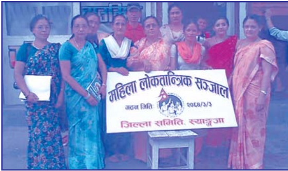
स्याङ्जा जिल्लामा जेष्ठ २८ गते महिला लोकतान्त्रिक संजालको जिल्ला सम्पर्क कार्यालय स्थापना गर्ने क्रममा साईन बोर्ड सहित संजालका पदाधिकारीहरू