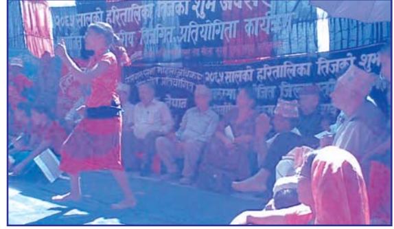
२०६५ भाद्र ७ गते महिला लोकतान्त्रिक संजाल कपिलबस्तुले आयोजना गरेको तीज गीत प्रतियोगितामा आफ्नो गीत र नृत्य प्रस्तुत गर्दै सहभागीहरू